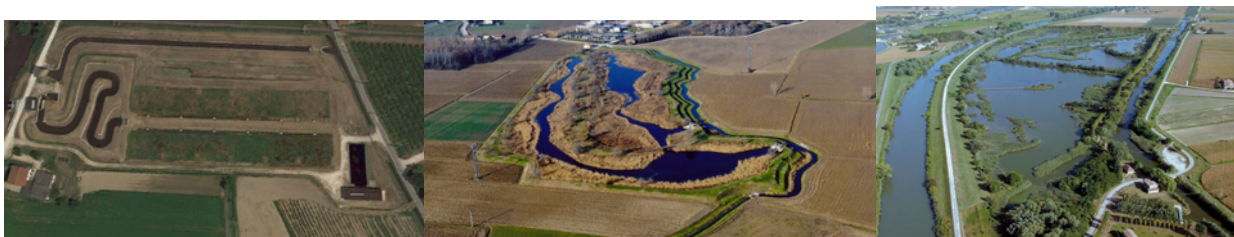
Figura 3. Le tre aree umide individuate per l'upscaling del piano di fitodepurazione: Monastiero - Bevilacqua (Verona), Monselice (Padova), Cà di Mezzo - Codevigo (Padova).